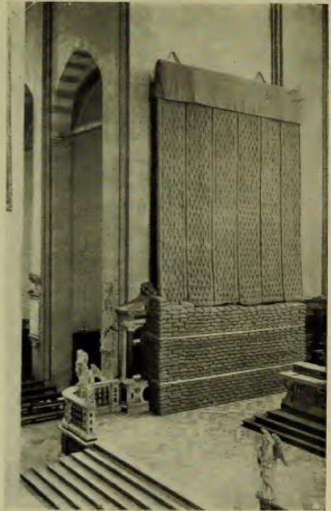
TREVISO - Difesa del monumento Onigo in San Nicolò.